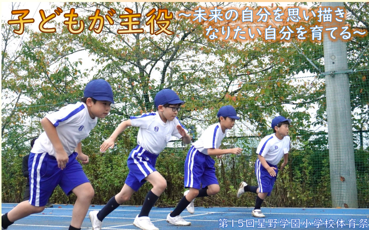
第15回星野学園小学校体育祭